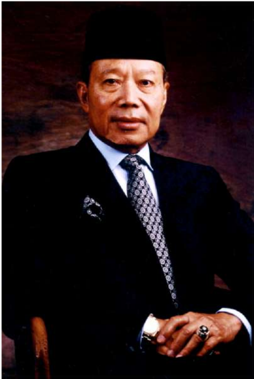
H. R. Probosutedjo Pendiri Universitas Mercu Buana