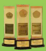
PTS UNGGULAN 2014

Program Magister Tahun Akademik 2020/2021