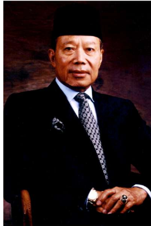
H. R. Probosutedjo Pendiri Universitas Mercu Buana